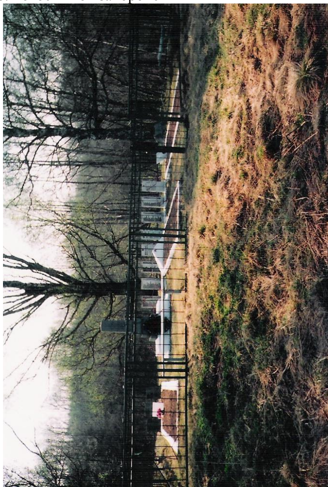
8. Фотоснимок захоронения